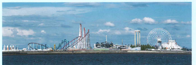
ナガシマリゾート Nagashima Resort