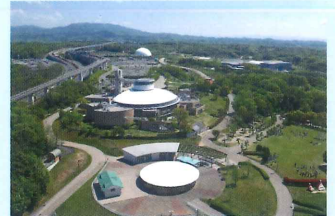
ジブリパーク 2022 Open Ghibli Park 2022 Open