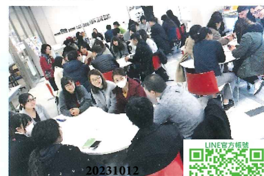
大學訪問 (學生交流)

일본어에 능력하고, 자립한 사람으로, 일본사회에서 공존할수 있도록 성장 지원