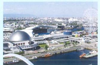
名古屋港水族館 Port of Nagoya Public Aquarium