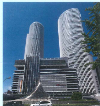
JR名古屋駅 JR Nagoya station