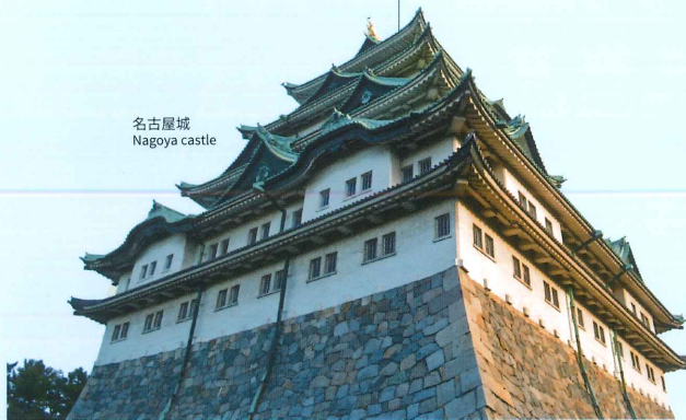
名古屋城 Nagoya castle