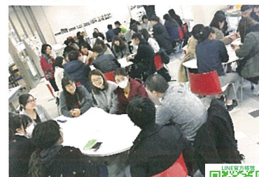
大学訪問 (学生交流)

將協助每位學員，不僅提升日語能力，更成為一個可以融入日本社會團體生活的人 将协助每位学员，不仅提升日语能力，更成为一个可以融入日本社会团体生活的人 일본어에 능력하고, 자립한 사람으로, 일본사회에서 공존할수 있도록 성장 지원