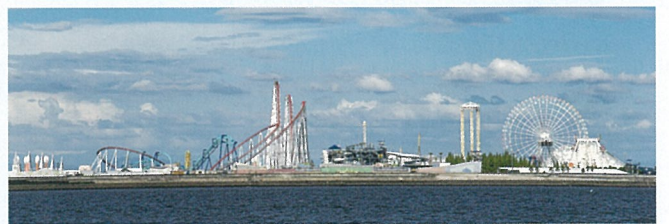
ナガシマリゾート Nagashima Resort