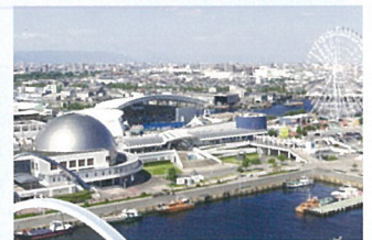
名古屋港水族館 Port of Nagoya Public Aquarium