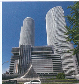
JR 名古屋駅 JR Nagoya station