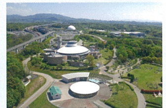
ジブリパーク 2022 Open Ghibli Park 2022 Open