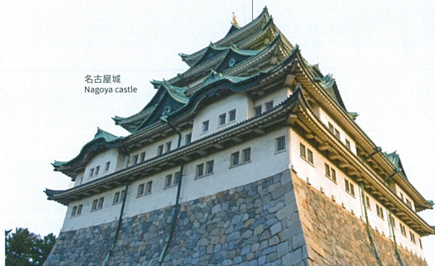
名古屋城 Nagoya castle

나고야시는 일본열도의 거의 중앙에 위치해 있는 아이치현 서부의 정령지정도시이며, 현청소재지입니다. 도쿄 23 구를 제외하면 요코하마시, 오오사카시를 뒤이어 일본에서 3 번째로 인구가 많은 도시입니다.